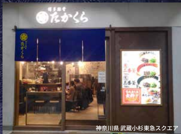
神奈川県 武蔵小杉東急スクエア